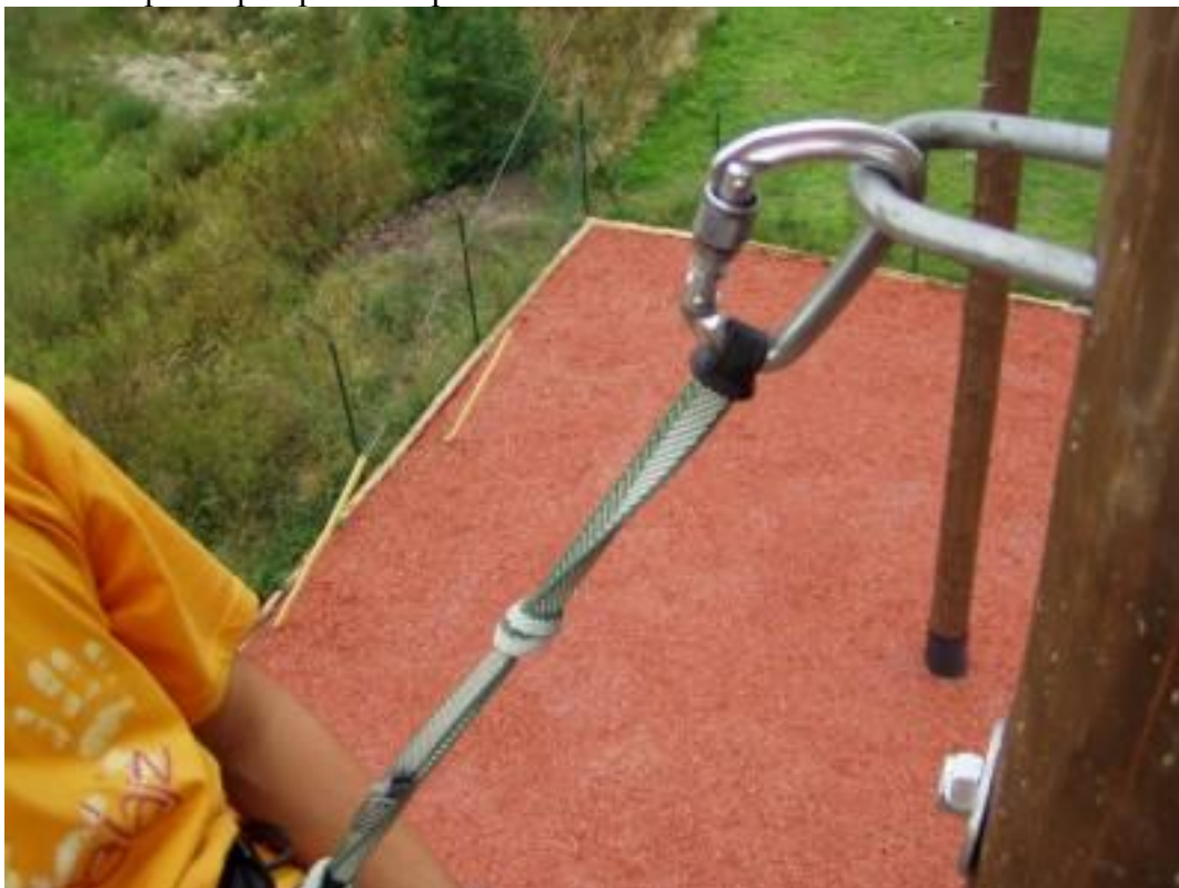
Obr 1 bezpečné při správném použití

V nedávné době jsem z blízkého okolí zaznamenal dva vážné pády ze skal, které jen velkou náhodou neskončily smrtelně. O jednom případě se zde na lezci již diskutovalo. K pádům došlo kvůli prasklé gumičce, kterou si někteří lezci připevňují (stabilizují) karabinu k odsedávací smyčce. Přestože je toto nebezpečí známé (například Petzl ho uvádí v návodu na použití gumových botiček obr.) myslím, že neuškodí se na Lezci o tomto nebezpečí zmínit. Pár lidí už gumičku z odsedávky vyhodilo, poté co uviděli potencionální nebezpečí. Vše ostatní je myslím patrné z fotografií a nákresu. Jednoduchým procvaknutím karabiny do oka odsedávky dojde k tomu, že se karabina ocitne mimo oko smyčky a karabina zůstane viset jen v gumičce!!!